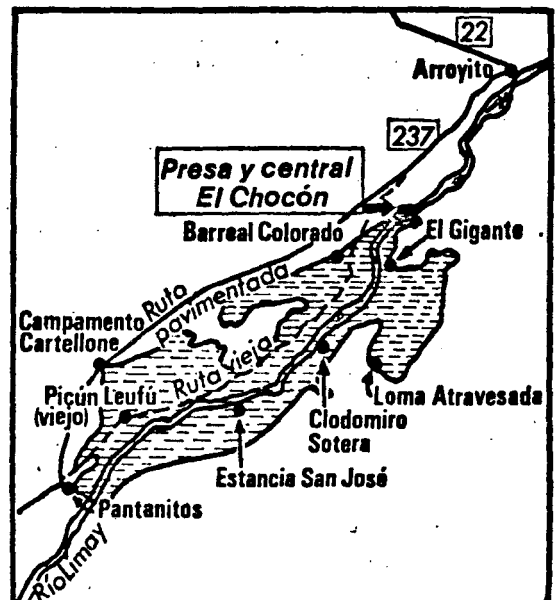
En el plano se puede apreciar el lago que se formará después de las obras de embalse

- Se iniciará el embalse del río Limay, en El Chocón, que una vez completado formará el espejo de agua de una superficie de 816 kilómetros cuadrados. Esta obra forma parte del complejo hidroeléctrico El Chocón-Cerros Colorados, cuya ejecución corresponde a la empresa Hidronor S.A.. El volumen máximo del lago artificial se alcanzará en el término de 7 meses y su profundidad será de 86 metros.