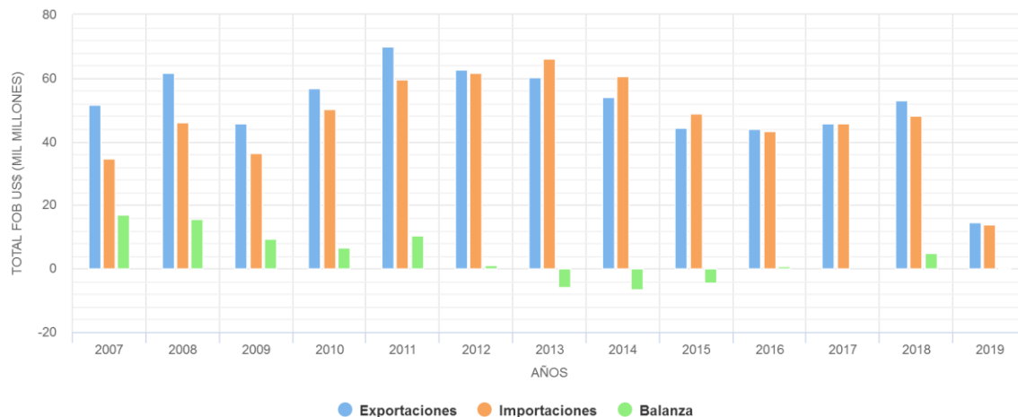
Cuadro 1 Exportaciones, Importaciones y Saldo MERCOSUR-UE 2007-2019